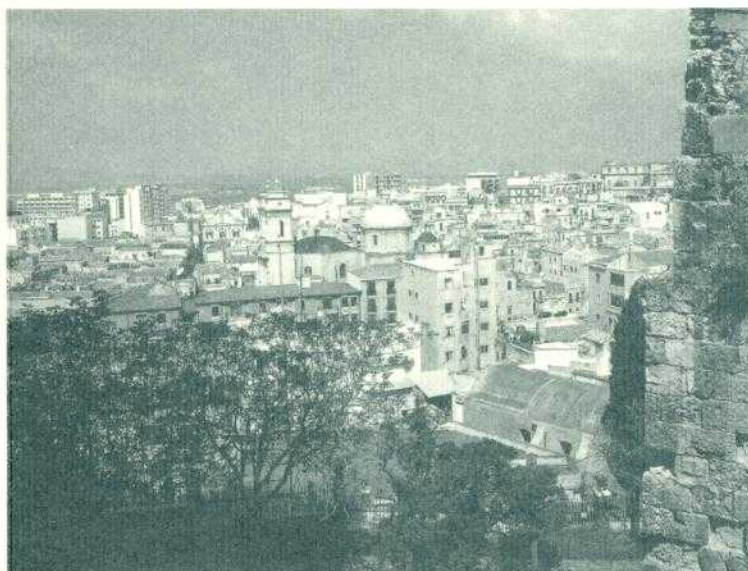
Stampa: Arti Grafiche Pivano, Cagliari