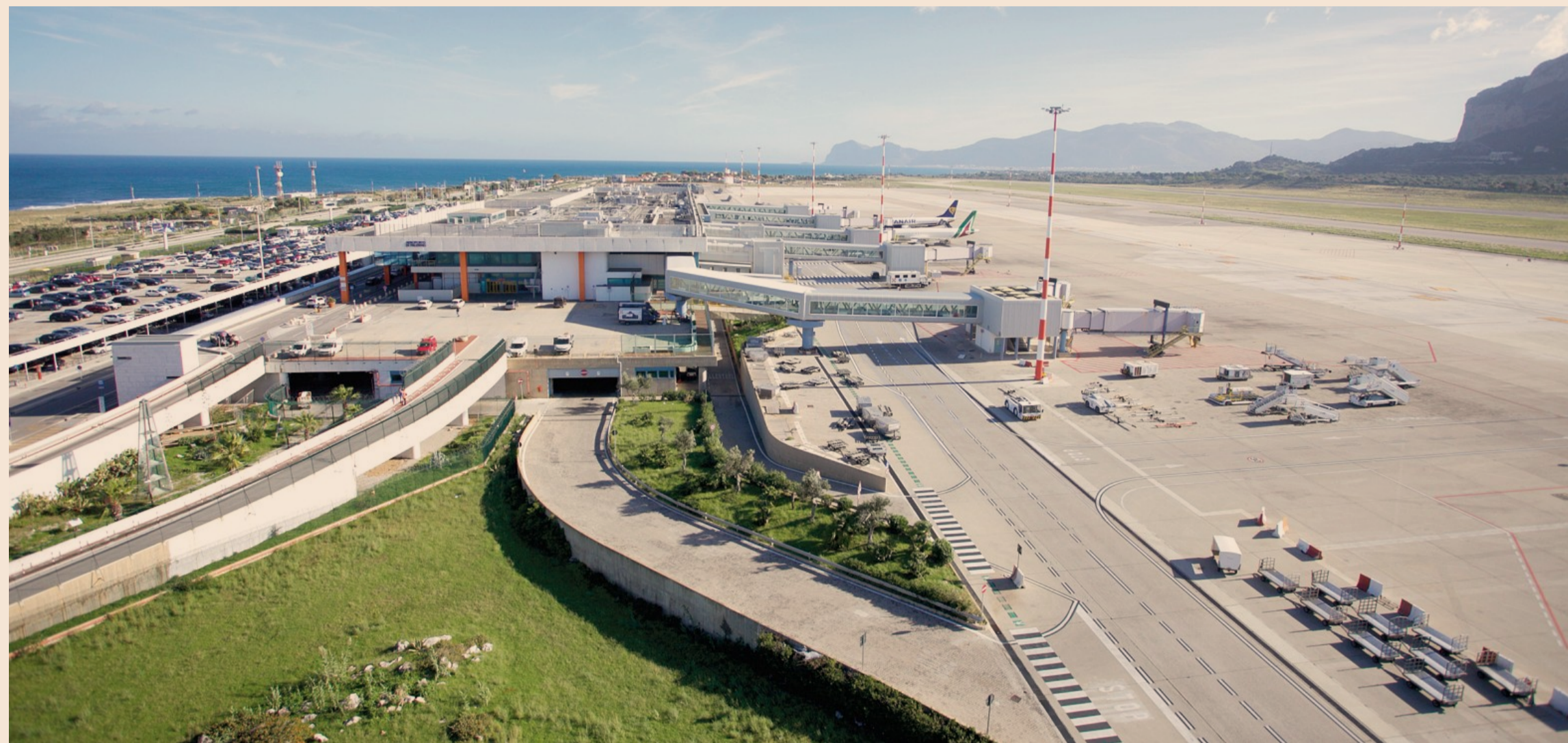
Lo scalo di Palermo. Punta Raisi ha chiuso il 2019 con poco più di sette milioni di passeggeri e un incremento sul 2015 del 42,9 per cento.

1 MILIARDO SPESA DEGLI STRANIERI IN SARDEGNA (GEN.-SET. 2019) | 375 MILIONI EXPORT ABBIGLIAMENTO IN CAMPANIA (GEN.-SET. 2019) | +3% PRESTITI ALLE FAMIGLIE IN SICILIA (SET. 2019)